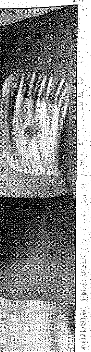
Ulla-Britt Ström har stora blånader och sexton djupa sår där hundens tänder trängt in.

jakt på varg, men anses också vara en bra sällskapshund.